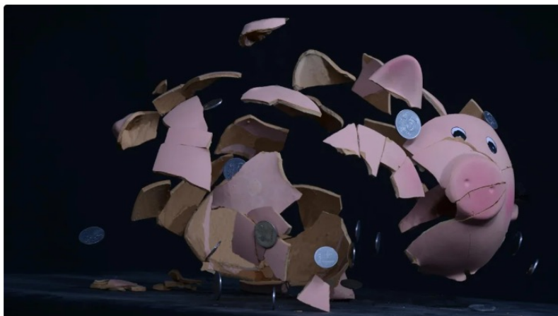
В 2024 году чистый приток иностранных инвестиций в Казахстан составил минус $2,55 млрд

Дарья Андреева обозреватель Forbes Kazakhstan