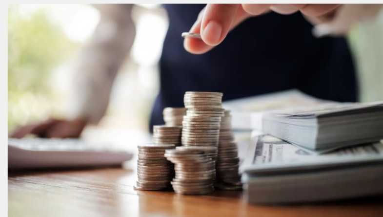
Приток прямых иностранных инвестиций в РК составил минус $2,55 млрд

Казахстан утратил 30-летнее лидерство в Центральной Азии (ЦА) по привлечению прямых иностранных инвестиций, следует из данных Конференции ООН по торговле и развитию (UNCTAD).